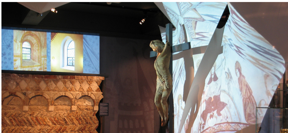
Randers Kulturhistoriske Museum