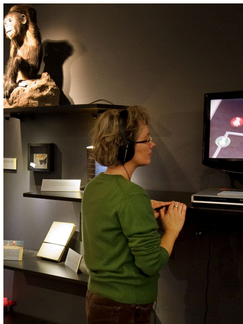
Steno Museet, Aarhus Universitet

Sekretariatet for Efter- og Videreuddannelse evu@au.dk, tlf. 8942 1110